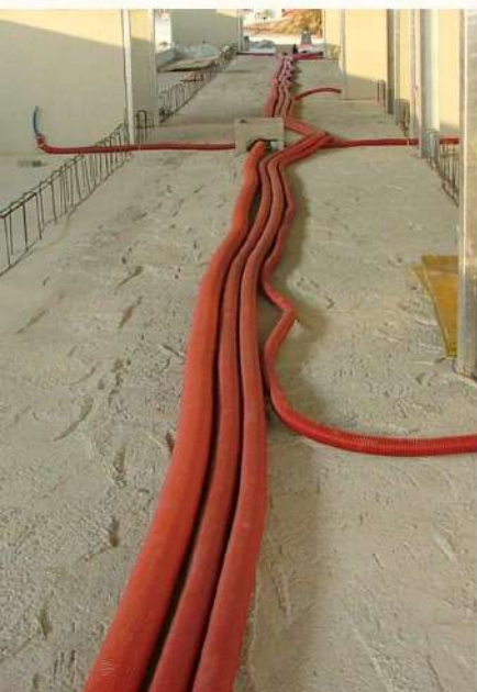
IMPIANTI E FOGNATURE