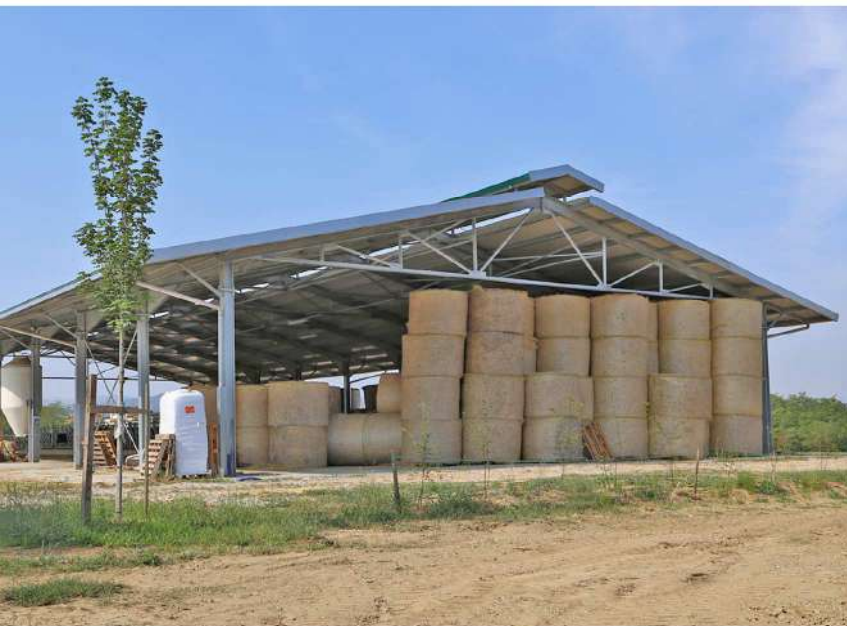
FIENILI STRUTTURE PREFABBRICATE IN FERRO O CEMENTO LOCALITÀ SAN BARTOLOMEO (RE)