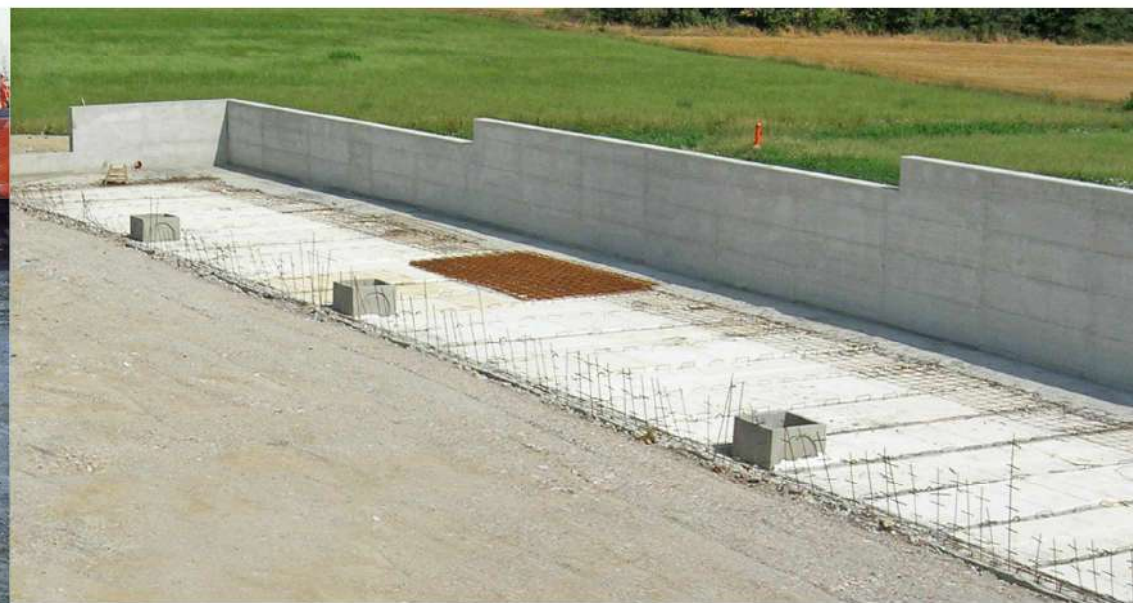
VASCHE DI ACCUMULO E STRUTTURE AUSILIARIE